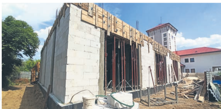
Budowa Biblioteki Publicznej Gminy Nieporęt

Biblioteka gminy Nieporęt i budynek liceum ogólnokształcące im. Stanisława Lema w Stanisławowie Pierwszym ostro pną się do góry. Jeśli chodzi o pierwszą inwestycję to trwają właśnie roboty murowo-żelbetowe. Wykonywany jest szalunek stropu nad parterem.